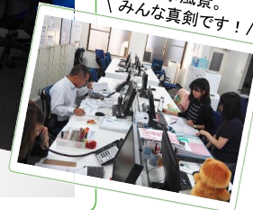
仕事風景。 みんな真剣です！